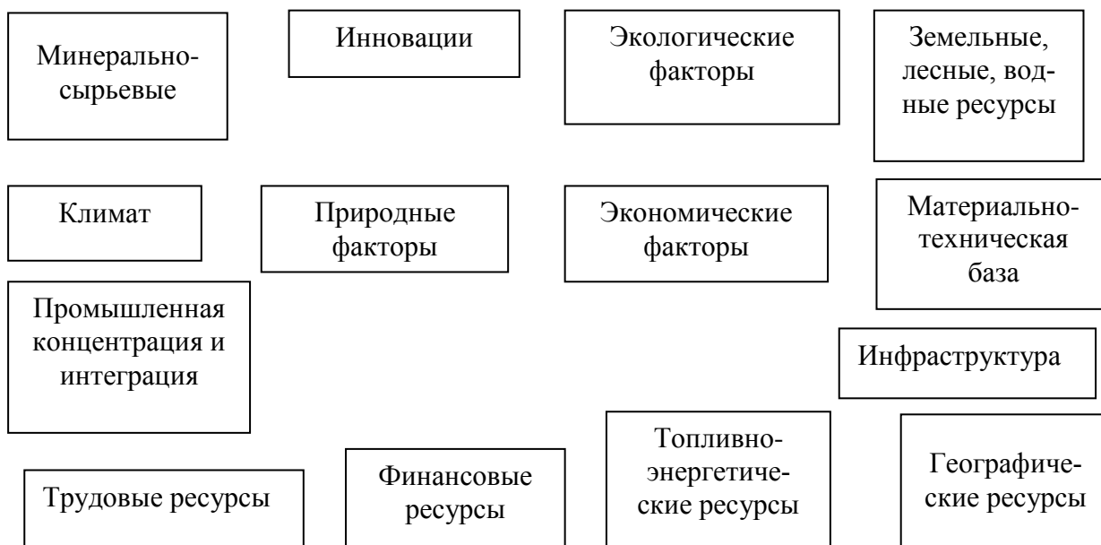
Рис. 1. Факторы размещения организации

Задача 1. Обозначьте стрелками принадлежность представленных факторов к группе природных или экономических.